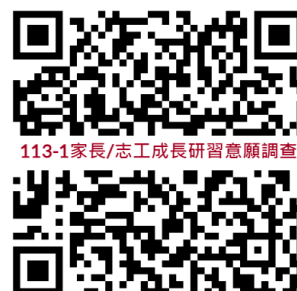
113-1家長/志工成長研習意願調查