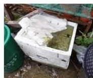
03 保麗龍盒、紙盒、餅乾盒